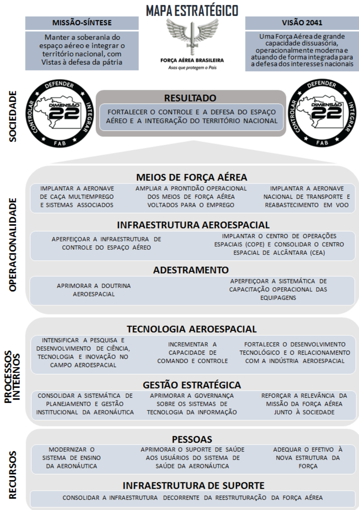
Figura 2 - Mapa Estratégico da FAB